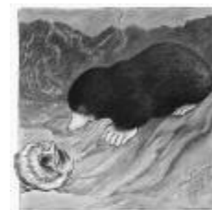
LE AVVENTURE DI KALLE, LA TALPA DEL MUSEO, P.86

Un altro esempio italiano presenta un modo insolito ma convincente di andare alla scoperta della loro vita quotidiana: Il pane. Forme e significato (pag. 96) mostra come nel pane si nascondano tradizioni e simboli. In Morto e sepolto (pag. 92), un esempio belga, un vecchio cimitero viene utilizzato per aiutare i bambini a confrontarsi con la morte, i funerali e le tradizioni religiose.